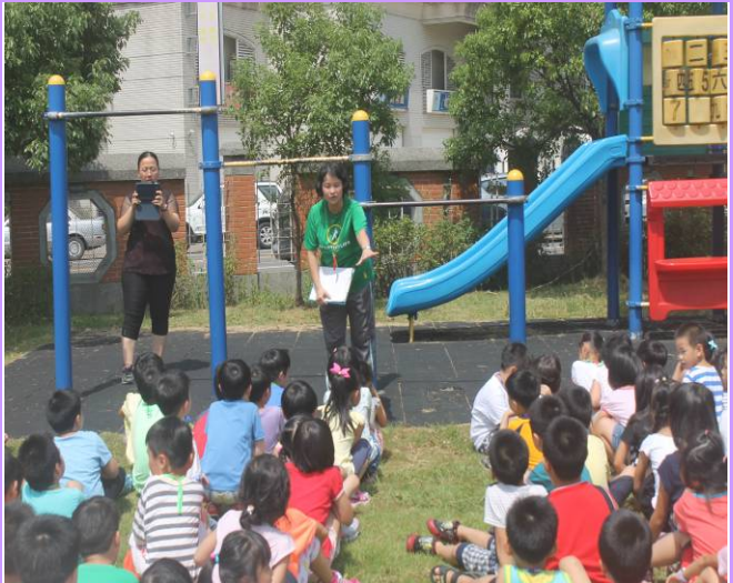
遊樂設施周邊設立使用規則望大家遵守